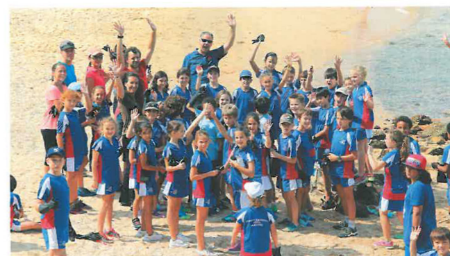
除了校內學習外，學校亦十分重視培養學生的公民意識，圖為參與社區的沙灘清潔。