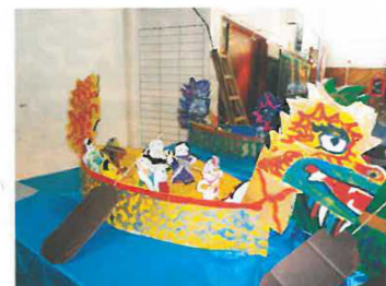
學生的設計中亦不乏香港特色，例如划龍舟。