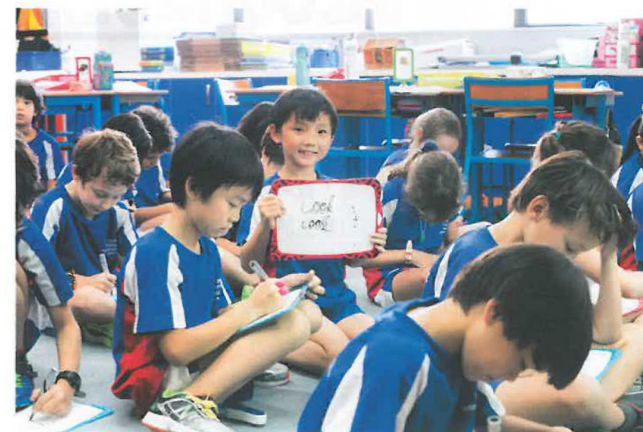
課堂上，老師會安排不同的活動，讓學生能主動參與之餘，更能享受學習。