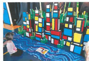
ArtWeek中展示了學生的不同作品，例如香港的「Hong Kong Skyline」。