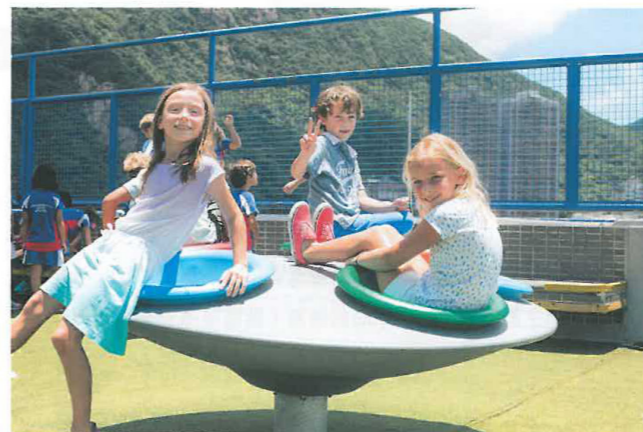
位於渣甸山的小學部，環境開揚，學生有足夠的活動空間。