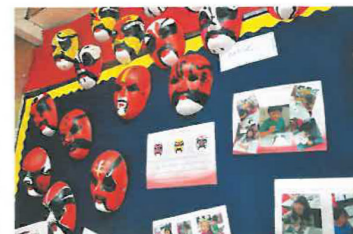
活動主題十分多樣，傳統如中式臉譜，學生可認識京劇的臉譜，不同顏色所代表的意義。