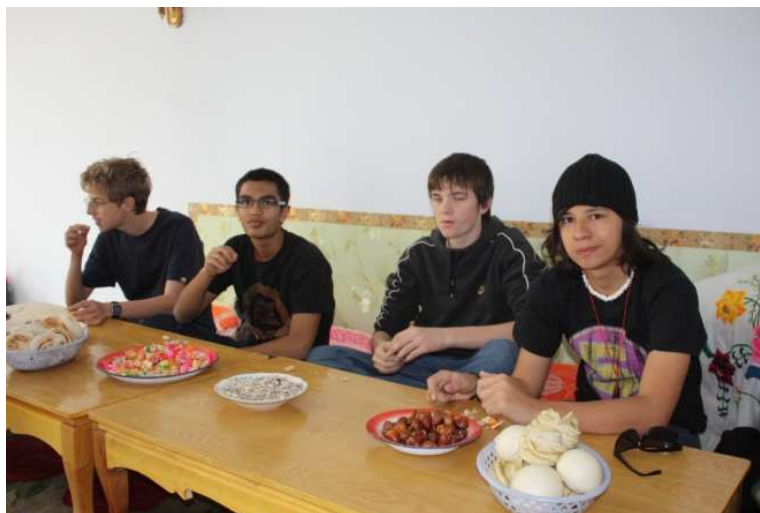
在海原县史店中心附近的笔友家，各种各样的小吃

Nous en mangeons une à deux fois par semaine. Des fruits très divers. Mais la plupart ne sont pas cultivés au Ningxia. Ils coûtent donc parfois cher.