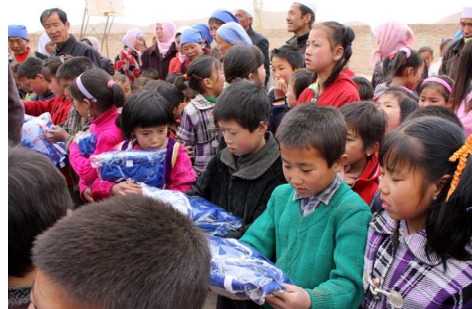
Arrivée à Lijiawa, l'accueil et la distribution des uniformes

Nous leur présentâmes nos cadeaux avec une certaine fierté. Après le discours de remerciements des enseignants, la cérémonie commença : un défilé « de mode » organisé par les petits écoliers suivis d'une séance de danse. Une grande joie avait envahi les esprits présents à ce moment. Nous mangeâmes par la suite dans une famille. Les hôtes étaient très accueillants et d'une amabilité et serviabilité sans comparaison possible avec celle des occidentaux. Nous fîmes nos adieux après un repas simple et copieux. Nous nous remîmes en route pour visiter à Tongxin un ancien temple lamaïste transformé en mosquée. Le sanctuaire avait été épargné des destructions durant la Révolution Culturelle grâce à Mao Zedong qui avait là prononcé un discours en l'honneur des Huis et de leur hospitalité au cours de la Grande Marche. De retour à l'hôtel, nous travaillâmes durant deux longues heures à rédiger notre journal de bord. Après cet effort phénoménal et intense, nous fûmes récompensés par un succulent repas et une bonne nuit de sommeil.