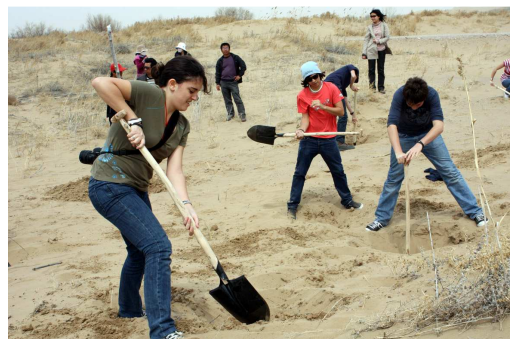
En plein effort ! Pas si facile de creuser dans le sable !

Nous avons planté chacun un arbre dans ce paysage surprenant afin de participer un peu à la lutte contre la désertification : un geste dérisoire en regard de l'échelle du fléau et surtout symbolique, mais qui nous donna à tous un certain sentiment de fierté.