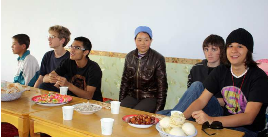
Accueil chez notre correspondant à gauche

Le dîner ou plutôt le banquet qui nous fut servi nous rassasia. Nous mangeâmes à quatre quatorze bols de nouilles de farine de riz cuites dans un bouillon très épicé, dans lequel avaient mijoté de petits morceaux d'agneau et des pommes de terre. Ce fut exquis et savoureux. Le sommeil eut raison de nous après une promenade digestive sous les étoiles dans la nuit fraîche (nous étions à 1300 mètres d'altitude environ)