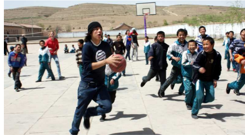
Match endiablé au collège Zhongxin de Shidian

Le lundi matin, le moment émouvant de notre journée ne fut pas la danse médiocre sur une idée de nos chers camarades de classe qui donna une charmante image de notre patrie à nos amis chinois mais le match amical de basket qui aboutit à notre glorieuse défaite et la remise des cadeaux aux enfants. Par ces gestes symboliques, ces enfants, dont la chance n'était pas de leur côté, furent comblés de joie : leurs regards étaient pleins de vie. Certains furent tellement émus qu'ils ne purent exprimer leur reconnaissance envers nous.